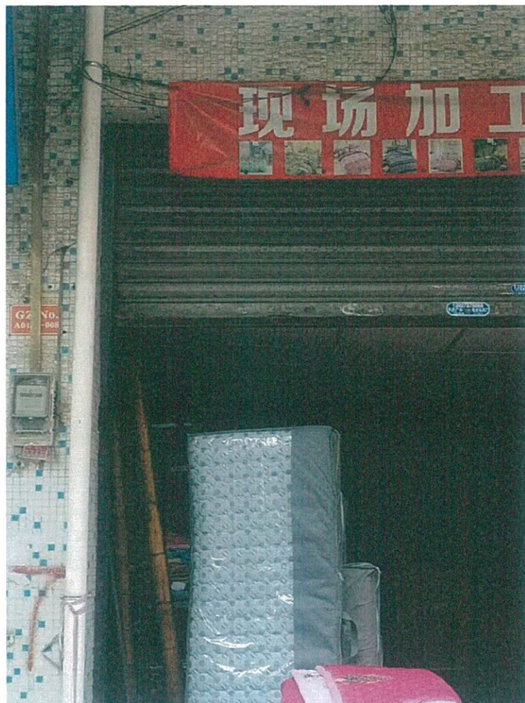
桂城街道平洲长塘街 8 号农机站宿舍楼首层 4 号铺 (GZA0473-008)