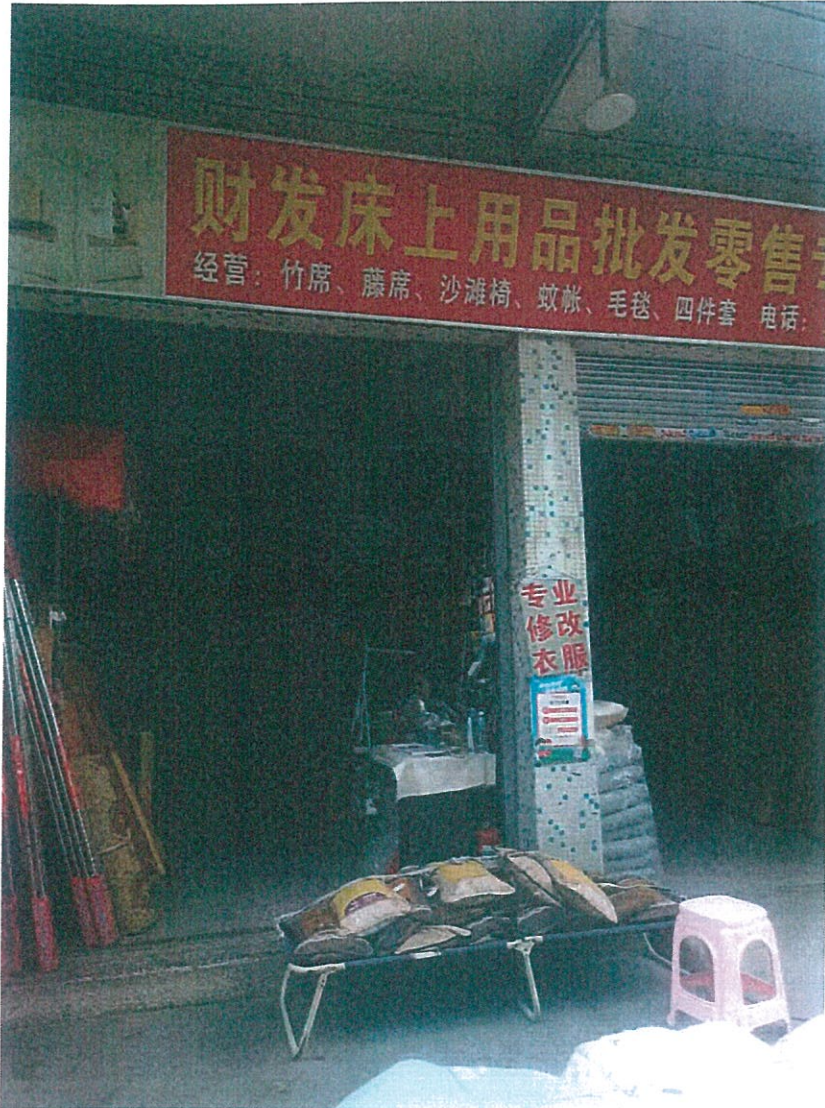
桂城街道平洲长塘街 8 号农机站宿舍楼首层 5 号铺 (GZA0473-009)