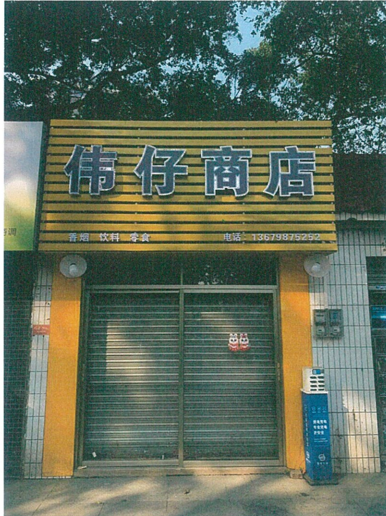
桂城街道平洲江滨公园 2 号铺 (GZA0026)