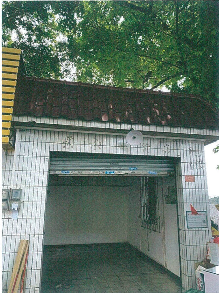
桂城街道平洲江滨公园 3 号铺 (GZA0027)