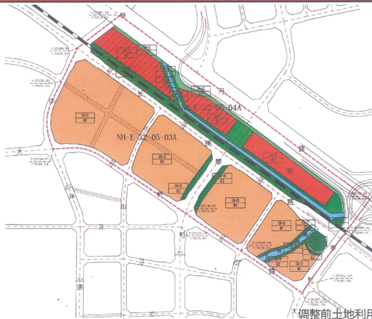
调整前土地利用规划图