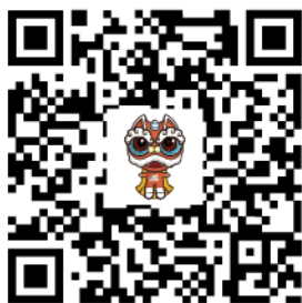
优粤佛山卡南海子平台微信公众号