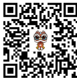
优粤佛山卡南海子平台客服微信